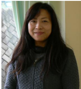
鶴川学童保育クラブ

4月から法人に新しい職員が勤務をしています。 前回3名の職員をご紹介しましたが、今回も他の3名の職員が自己紹介をいたします。