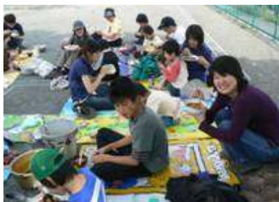
<みんなでカレーライスとトン汁> 「いただきまーす！」

同時進行していたお父さんたちによるカレーとトン汁作り（材料の野菜は前日に2・3年生が切ったもの）も大きな寸胴3つ分、できあがり。おおぜいで食べる食事は格別においしかったです。