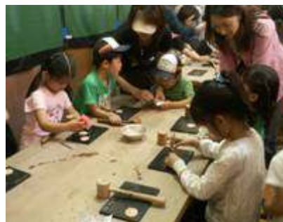
<刻印を押しています>

3つの大鍋にできたトン汁はそれぞれに少しずつ味が違い、「3杯おかわりしよう！」と意気込んで食べた結果、やはり「自分たちのグループで作ったトン汁が一番おいしい！」ということに落ち着きました。