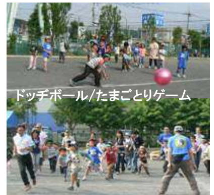
ドッジボール/たまごとりゲーム

飯ごうの蓋でお米をはかたり、マッチをする練習をしてマキに火をおこし、ご飯の炊ける音を聞きながら火から上げるタイミングを決めていきました。この一連の作業を全員が体験できるよう順番に進めていきます。ご飯の炊き上がりは各班まちまちで、程よく炊き上がった班やおこげが多いところもありましたが、子どもたちにはおこげは大人気でした。