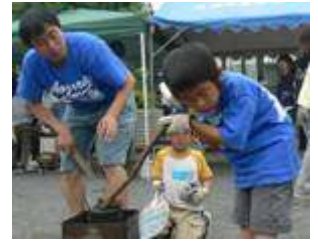
<棒とお椀で炊き上がりの音を聞く>

5月19日、あいにくの天候のなか始まったあおぞらクラブのデイキャンプでしたが、幸いにも集合時間に本降りだった雨が活動開始するころにはあがり、お昼前には日差しを避けたくなるほどのいい天気になりました。7月に控えた2泊3日の本キャンプの練習を兼ね、毎年この時期に行っています。約90人の参加があり、子どもも大人もおいしいご飯とレクリエーションで楽しい一日をすごしました。 さて、あおぞらクラブのデイキャンプは、どこか遠くに行くわけではなくクラブに併設する成瀬センターのグラウンドで、手作りの一斗缶のカマドを使って、飯ごうでご飯を炊く練習をするのがメインイベントです。子どもと保護者の合同班4班に加え、『卒会した兄姉と手伝いにきた中・高校生がちびっ子（4・5才）に教える班』の計5班に分かれて、「口は出すけど、手は出さず」を大人の合言葉に、作戦会議をしてからスタートしました。