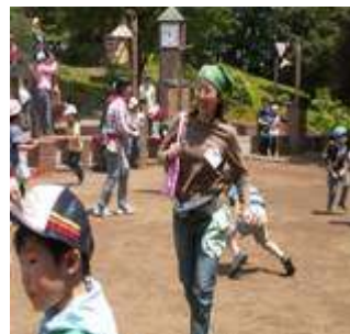
<しっぽとりゲーム>

5月12日に親子新入生歓迎会のデイキャンプをひなた村で行い、トン汁をつくりました。150人ほどの参加で5グループに分かれて作業を開始。包丁やピーラーを使うのが初めての子どももいましたが『野菜を切るのは子どもの仕事』ということで保護者の方が見守ってくださる中、大きな怪我もなく終了。「たくさん切りすぎて、手がしびれた～」と言うほど頑張ってくれました。