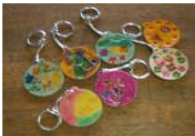
<できあがったキーホルダー>

午後はひなた村の職員の方の説明を受けた後、親子で革のキーホルダー作りをしました。木槌を使って刻印を押したり、自由に絵を画いたりなど個性が光る素敵なキーホルダーが出来上がり「子どもよりも大人の方が真剣になっちゃいました…」という感想も寄せられました。