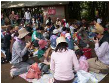
<おいしいトン汁、いただきま〜す>

鍋でトン汁が煮える間、てっぺん広場で子どもたちと手のあいたお父さんお母さんが一緒にゲームをして楽しみました。『仲間あつめゲーム』では「学年ごとに集まれ！」という指令のもと集まった1年生の親子を紹介したり、その後の『しっぽとりゲーム』では大人も童心に帰り子どもたちと一緒にいい汗を流しました。ゲームをしている間に味噌のおいしそうな香りが漂い、いよいよ食事タイムです。