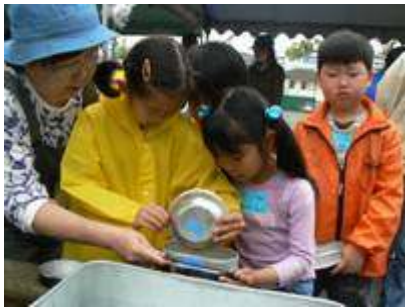
<飯ごうで炊飯の準備>

5月19日、あいにくの天候のなか始まったあおぞらクラブのデイキャンプでしたが、幸いにも集合時間に本降りだった雨が活動開始するころにはあがり、お昼前には日差しを避けたくなるほどのいい天気になりました。7月に控えた2泊3日の本キャンプの練習を兼ね、毎年この時期に行っています。約90人の参加があり、子どもも大人もおいしいご飯とレクリエーションで楽しい一日をすごしました。 さて、あおぞらクラブのデイキャンプは、どこか遠くに行くわけではなくクラブに併設する成瀬センターのグラウンドで、手作りの一斗缶のカマドを使って、飯ごうでご飯を炊く練習をするのがメインイベントです。子どもと保護者の合同班4班に加え、『卒会した兄姉と手伝いにきた中・高校生がちびっ子（4・5才）に教える班』の計5班に分かれて、「口は出すけど、手は出さず」を大人の合言葉に、作戦会議をしてからスタートしました。