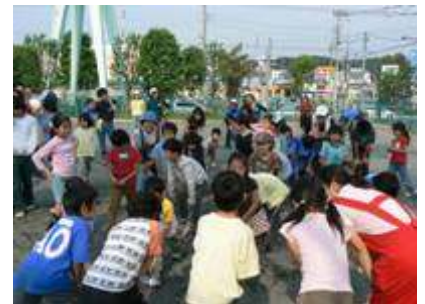
<最後のシメはやっぱり「チクサク」で>

おわりのつどいで「おいしいご飯が炊けたぞ！オー！」「キャンプにむけてがんばるぞ！オー！」「チクサク チクサク ホイホイホイ・・・」と班長さんを中心に『チクサク（掛け声）』をして終わりました。2泊3日のキャンプにむけてみんなの気持ちがひとつになったデイキャンプでした。