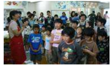
<はじめてのつどい>