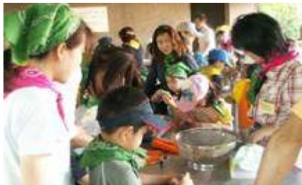
<トン汁の材料を切っています>

5月12日に親子新入生歓迎会のデイキャンプをひなた村で行い、トン汁をつくりました。150人ほどの参加で5グループに分かれて作業を開始。包丁やピーラーを使うのが初めての子どももいましたが『野菜を切るのは子どもの仕事』ということで保護者の方が見守ってくださる中、大きな怪我もなく終了。「たくさん切りすぎて、手がしびれた～」と言うほど頑張ってくれました。